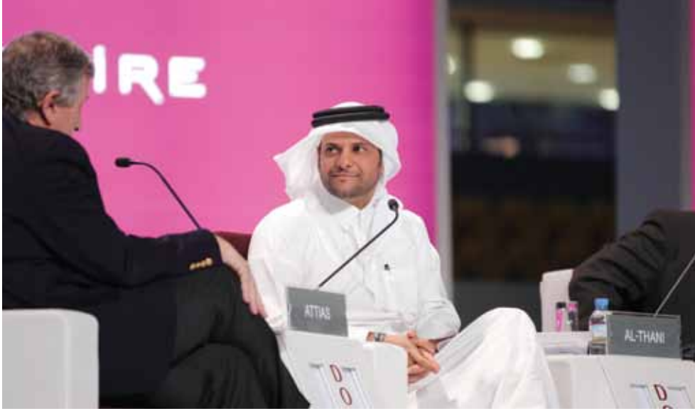
Qatar Olympic Committee Secretary General HE Sheikh Saoud bin Abdulrahman Al- Thani

سعادة الشيخ سعود بن عبد الرحمن آل ثاني أمين عام اللجنة الأولمبية.