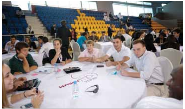
Connection and ideas exchange at Doha GOALS فرحة الحضور بالتواصل مع الآخرين في الدوحة جولز وتبادل الأفكار