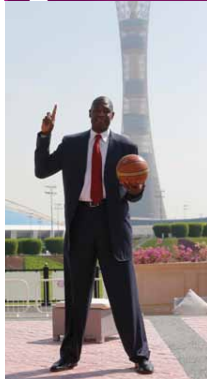
NBA Basketball champion, Dikembe Mutombo visits ASPIRE4SPORT.

بطل كرة السلة الأمريكية ديكمبي موتومبو يزور معرض ومؤتمر ASPIRE4SPORT.