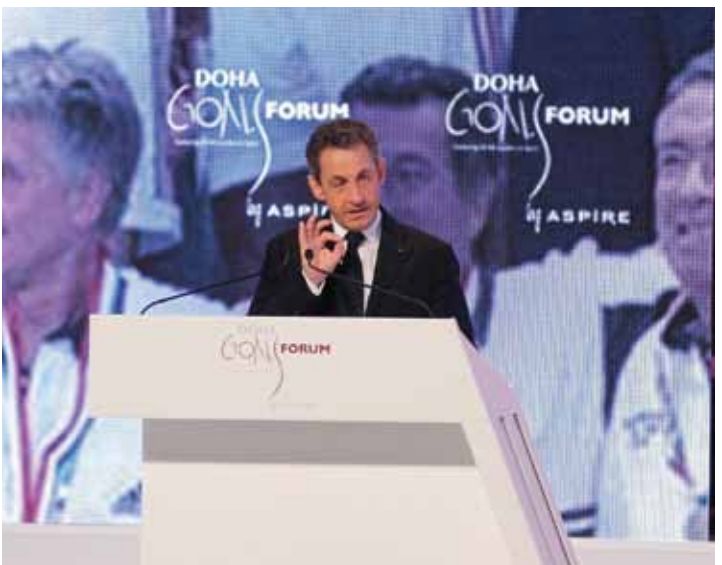
Former President of the French Republic, Nicolas Sarkozy

رئيس الإتحاد الدولي لكرة القدم السيد جوزيف سيب بلاتر يتحدث عن تجربته لحضور الدوحة جوائز