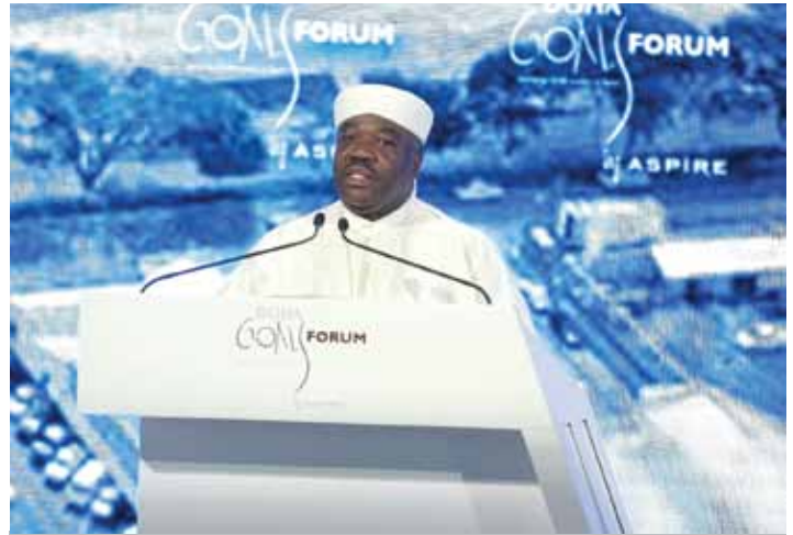
President of the Gabonese Republic, His Excellency Ali Bongo Ondimba