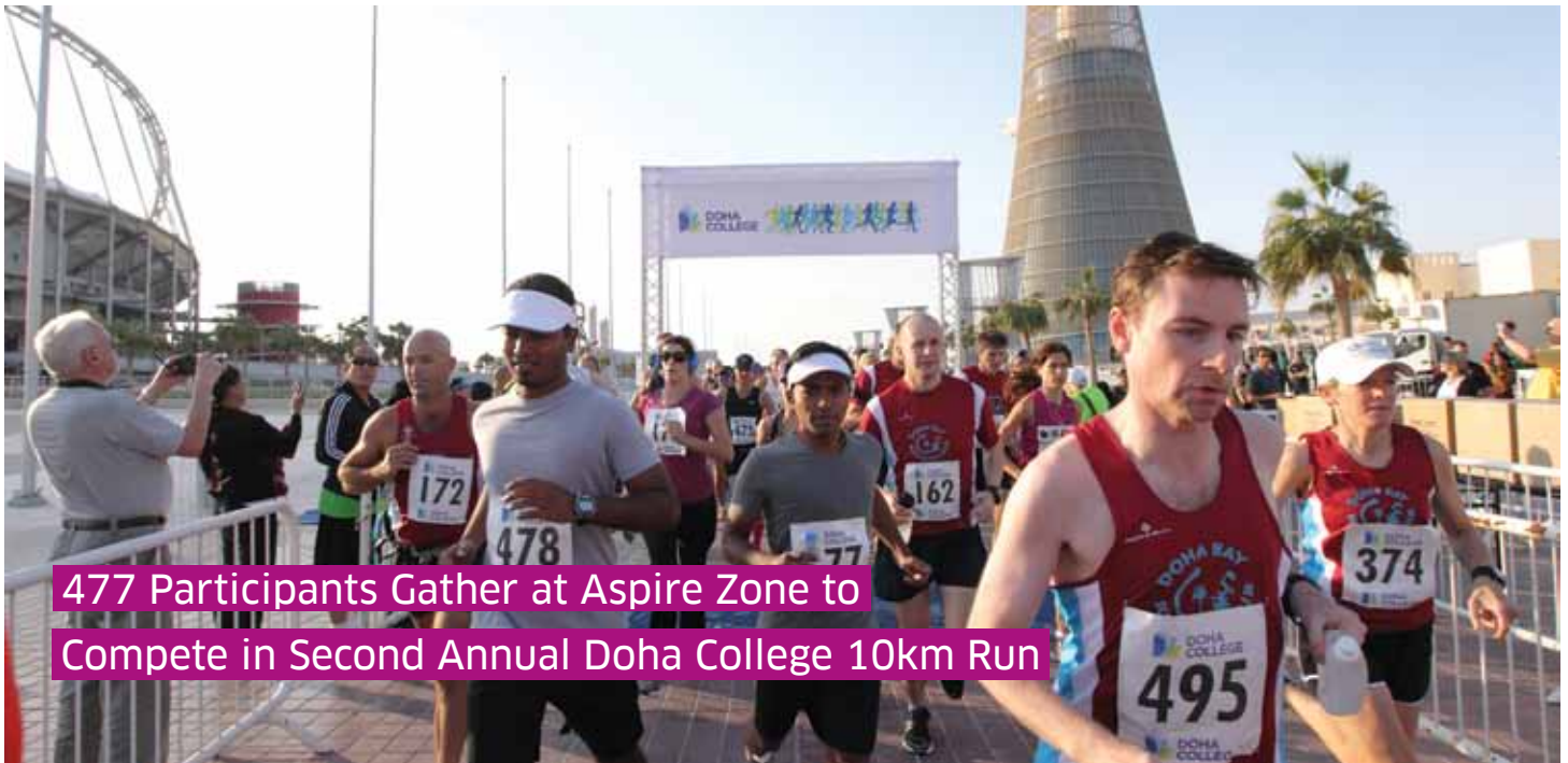
477 Participants Gather at Aspire Zone to Compete in Second Annual Doha College 10km Run