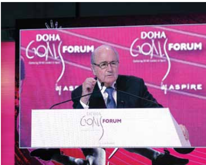
President of FIFA Sepp Blatter talking about his experience of achieving goals

رئيس جمهورية الغابون فخامة السيد علي بونغو أونديمبا متحدثاً إلى جمهور الدوحة جوائز