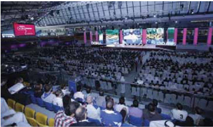
Crowds gathered at Aspire Dome to attend Doha GOALS حضور غفير لمنتدى الدوحة جولز في قبة أسباير