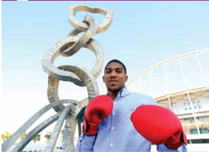
Olympic champion, Anthony Joshua visits the Olympic Rings at Aspire Zone.

البطل الأولمبي أنتوني جوشوا يزور الحلقات الأولمبية بأسباير زون.